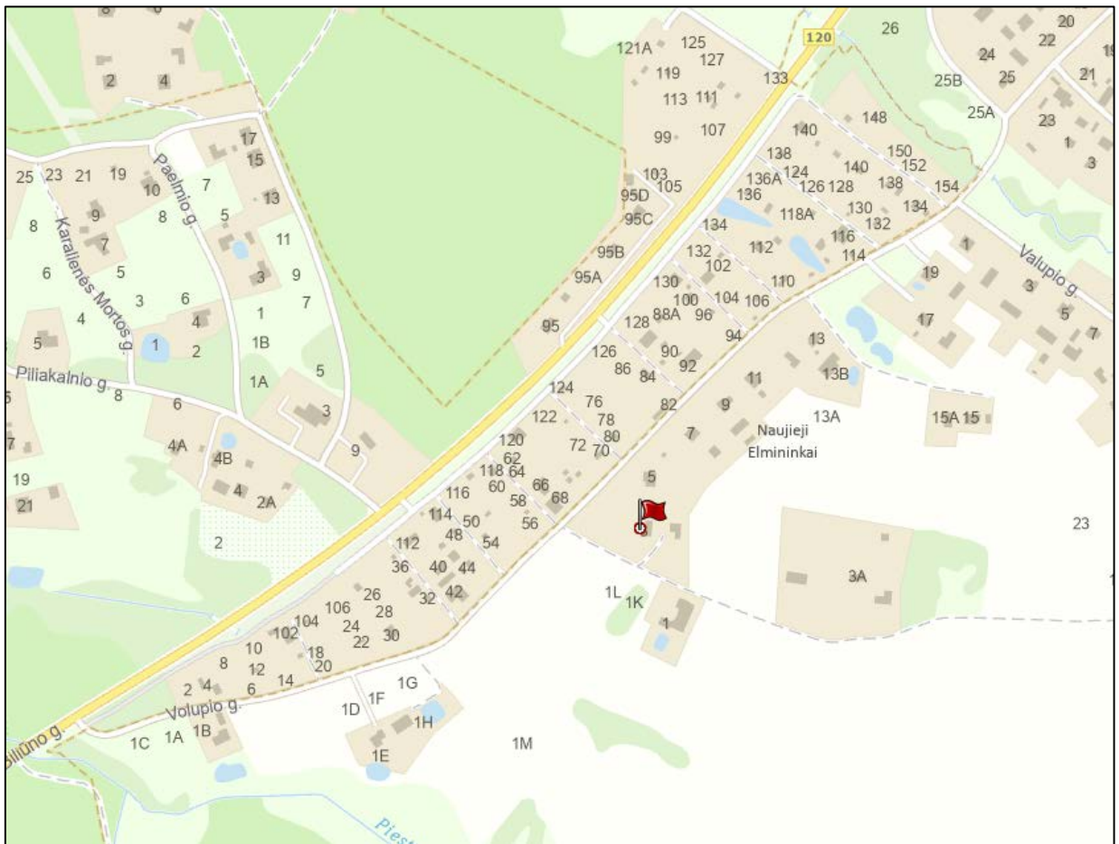
1. Pav. Objekto vietovės schema