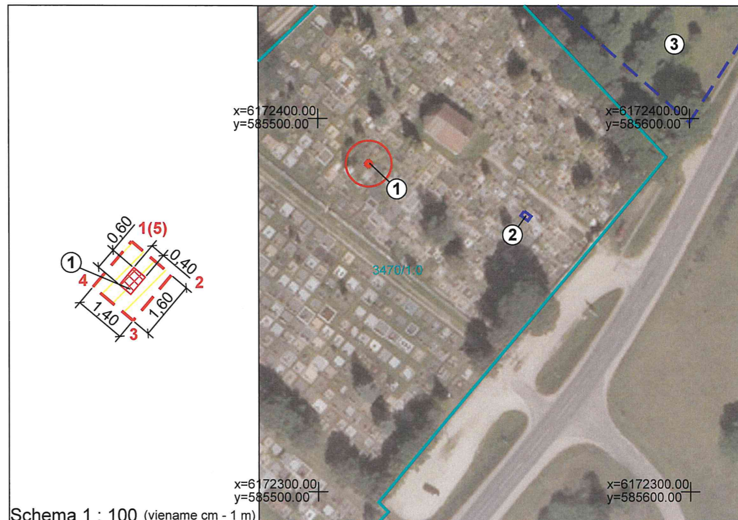
Schema 1 : 100 (viename cm - 1 m)

x=6194000.00 y=419000.00 Koordinatinių tinklelio sankirta