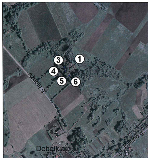
M 1 : 10 000 (vienne cm - 100 m)

Debeikių mstl., Debeikių sen., Anykščių r. sav.