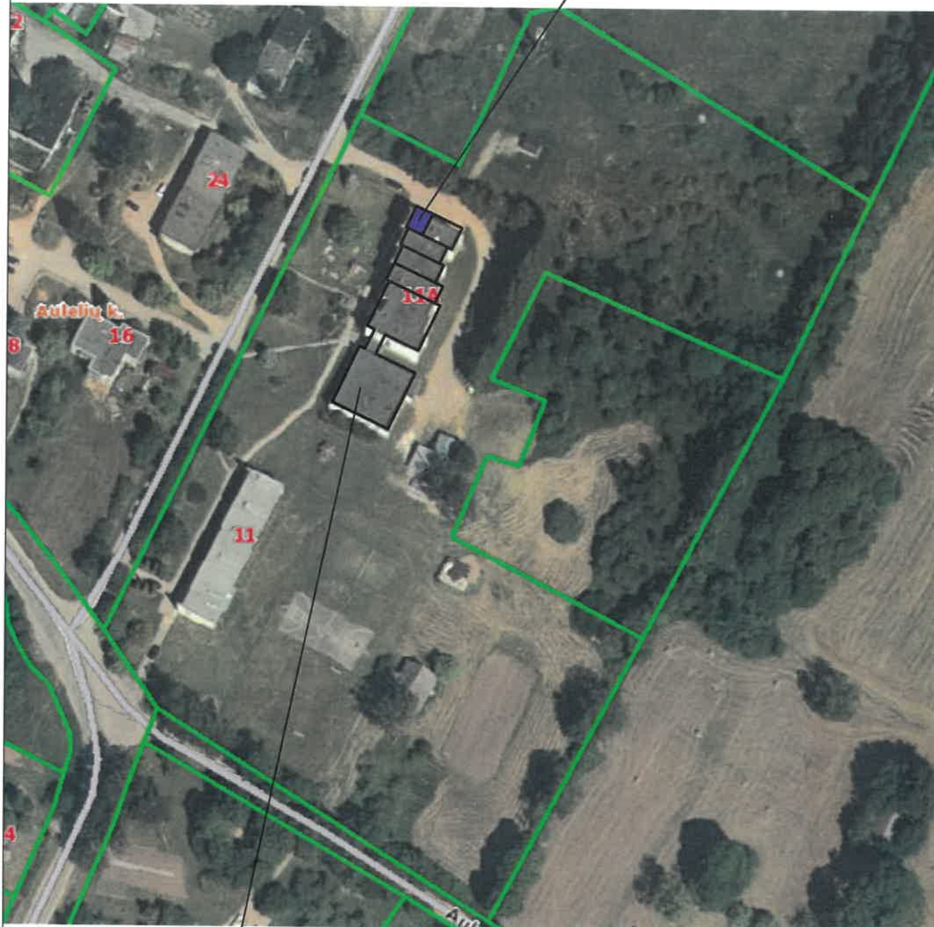
Patalpa-bendrabutis-valgykla (unikalus Nr. 4400-3070-5792:5204)

Patalpų (unikalus Nr. 4400-3070-5792:5206), esančių pastato pirmajame aukšte, gydymo paskirtis keičiama į gyvenamąją (įvairioms socialinėms grupėms).